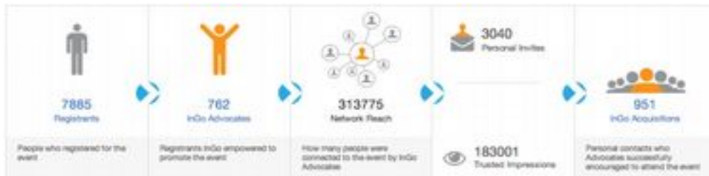
Statistiken von InGo: Social Media und Empfehlungsmarketing Erweiterung für FairMate

gewonnen wurden; Zahl der Neukunden; wer wirbt wen; welche der Besucher sind besonders gut vernetzt und schaffen es, über ihre Empfehlung, besonders relevante Kontakte für die Messe zu gewinnen?